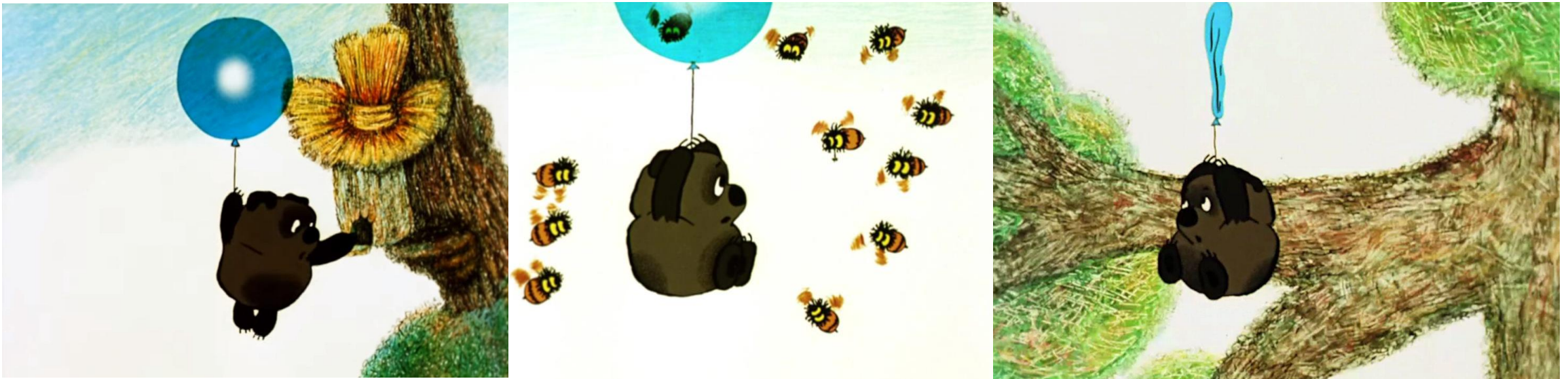
Кадры из м/ф «Винни-пух»

Пример риска: к установленному сроку не доставлены печатные материалы для курса из-за технических неполадок в типографии